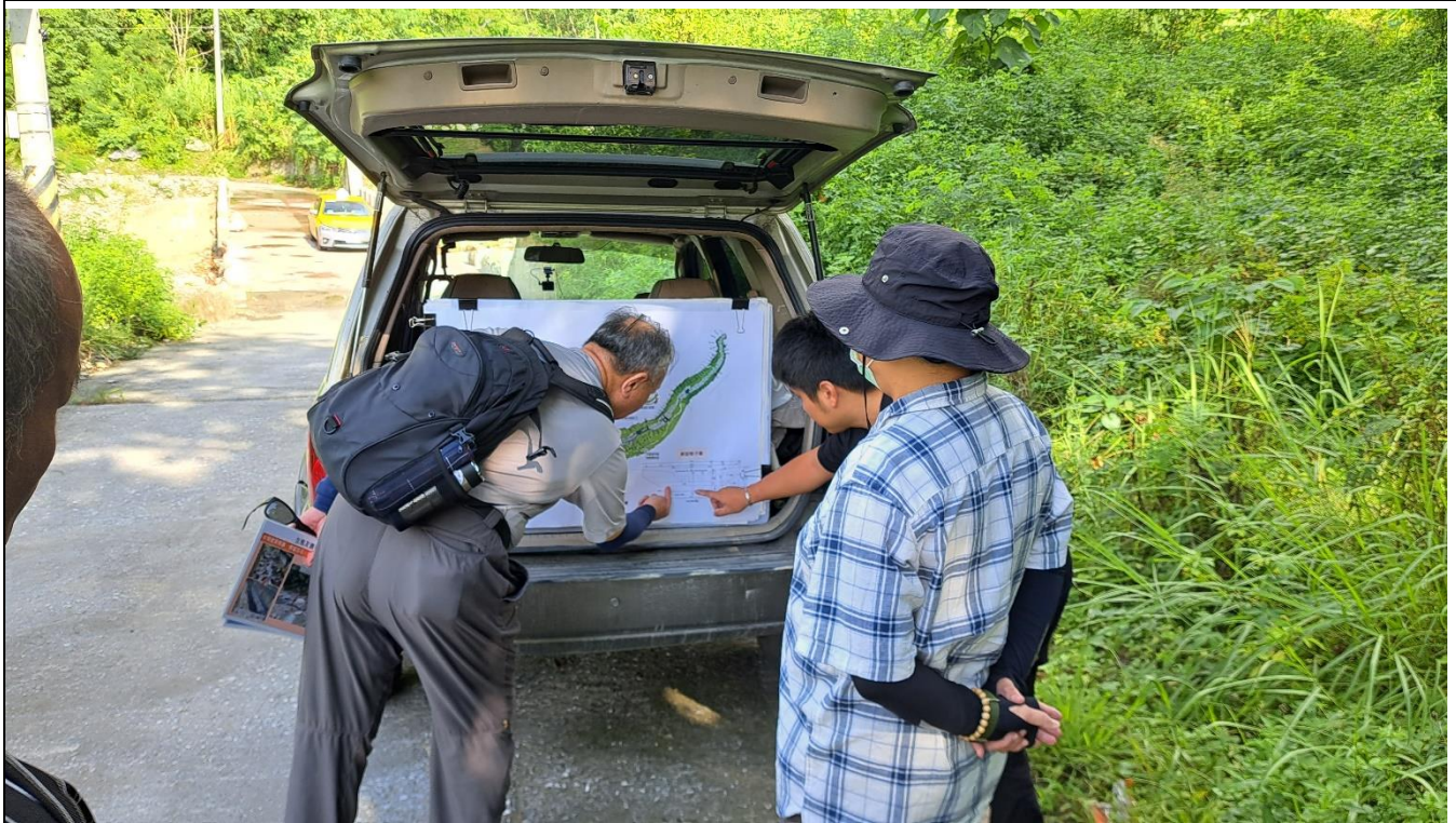
照片說明：監造單位向現場人員說明及討論